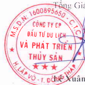
Đỗ Xuân Quế